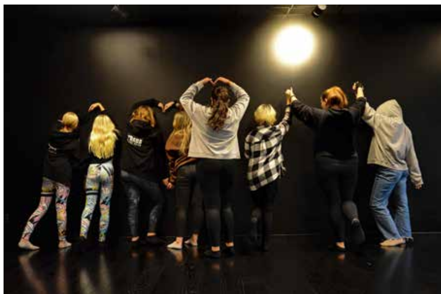
– När jag kommer hem har jag fortfarande kvar dans i kroppen, säger en av tjejerna.