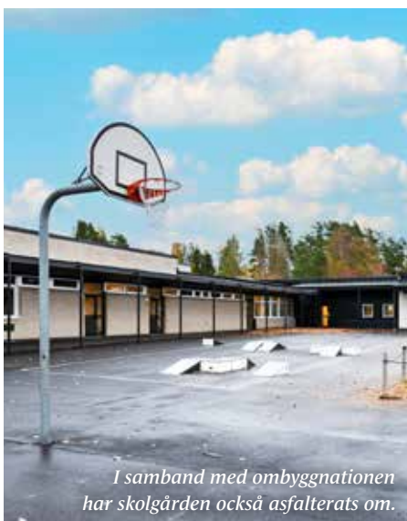
I samband med ombyggnationen har skolgården också asfalterats om.

De senaste årens barnkullar är större och med sexornas återtag krävdes en ombyggnation av Åsbro skola för att ge plats åt alla elever.