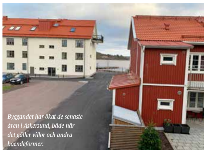
Byggandet har ökat de senaste åren i Askersund, både när det gäller villor och andra boendeformer.

När konsultföretaget WSP har gått igenom genomförda fastighetsaffärer över tid visar det sig att Askersunds kommun har legat på Tobins Q-värden på mellan 0,5 och 0,8 sedan tidigt 1980-tal. Efter 2010 har det dock börjat hända saker och det senaste värdet är 1,15. Detta placerar Askersund som tvåa i länet efter Örebro, från att tidigare ha haft en position i länets mittfält. Askersund och Örebro är också de två kommuner som har gått fram mest under mätperioden. Jämfört med den relativt låga nivån av bostadsproduktion under lång tid har det hänt en hel del på senare år i Askersunds