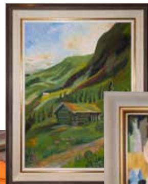
Några av Ulla-Britts alster.