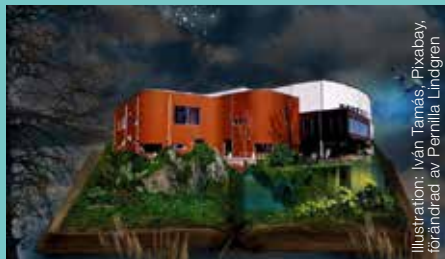
Illustration: Ivan Tam s, Pixabay, f r ndrad av Pernilla Lindgren