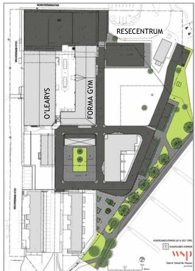
Skiss över hur området utformas.