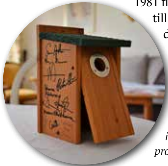
Den här holken är bara ett exempel på hur kameror doldes under inspelningen. Nu har kameran tagits ut, och ersatts av signaturer från produktionsteam och utredargruppen.