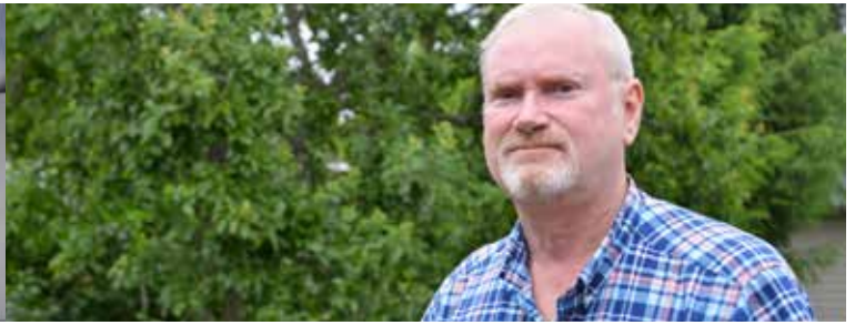
Owe har under åren varit aktiv i flera lokala föreningar och har ett utbredd kontaktnät i kommunen.