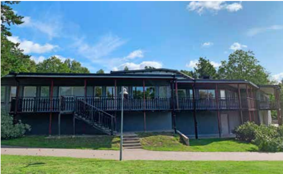
Den här delen av Närlundaskolan ska enligt förslag rymma kök och matsal i framtiden.