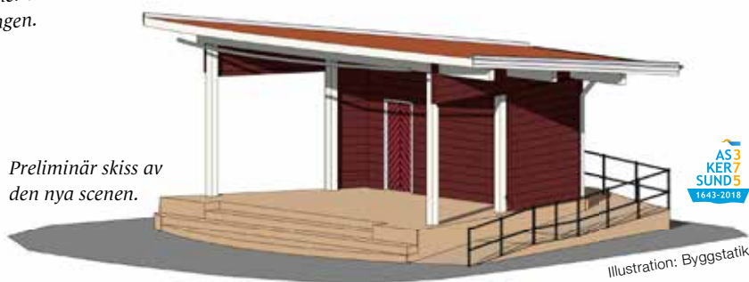
Preliminär skiss av den nya scenen.