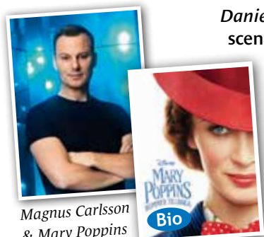
Magnus Carlsson & Mary Poppins kommer till Sjöängen.

Följ oss på facebook: www.facebook.com/sjoangen