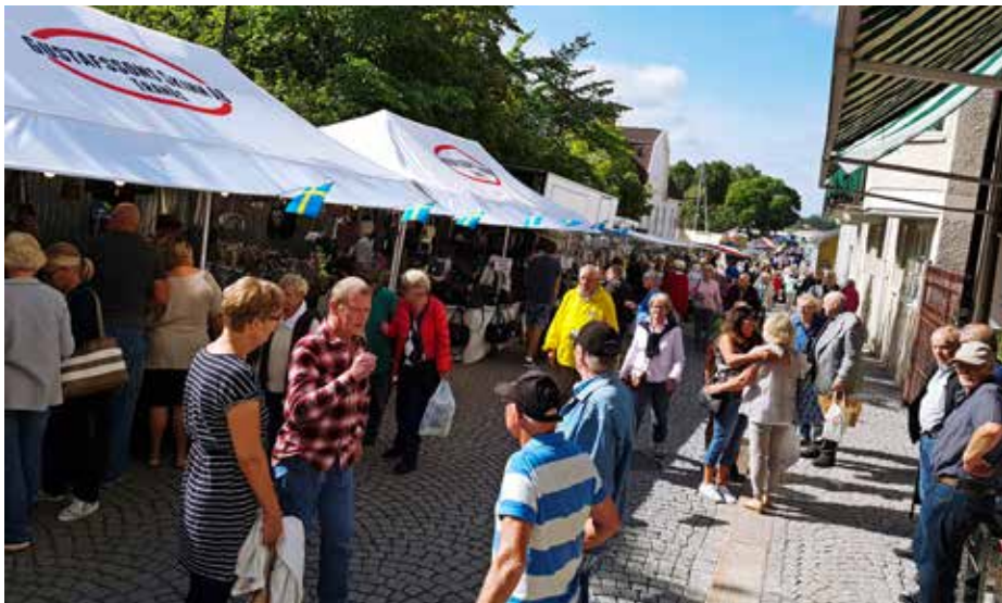
Höstmarknaden i Askersund är ett exempel på aktivitet som behöver markkupplåtelse.