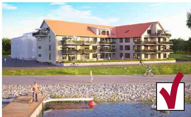
Byggstart avböckad 9 november – inflytt 2018.

Den nionde november hölls avbockning för byggstarten av nästa flerfamiljs-hus på Västra Strandparken. Innobo bygger 22 lägenheter som beräknas vara