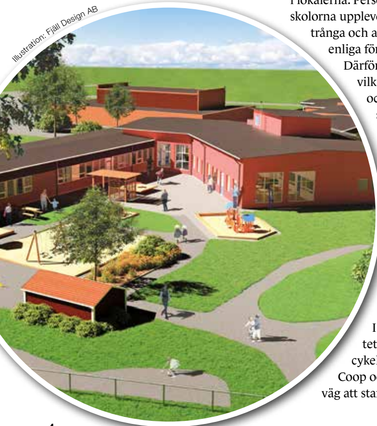
Illustration: Fjäll Design AB