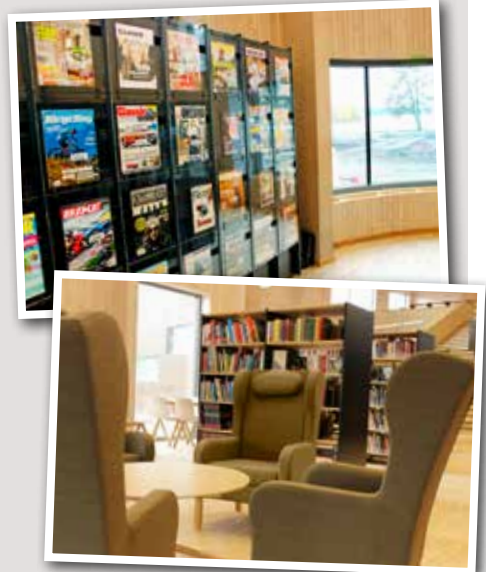
Njut av en lässtund vid vår välfyllda tidskriftsavdelning med utsikt över Alsen.

Bibliotekets bok- och filmklubb drar igång igen i januari/februari. Vi ser filmer som baseras på en bok och efteråt fikar vi tillsammans och diskuterar. Medlemmar får ett nyhetsbrev med information inför varje tillfälle. Du som vill bli medlem kan anmäla dig via e-post, telefon eller personligen i biblioteket. Telefon: 0583-810 95, e-post: bibliotek@asksund.se