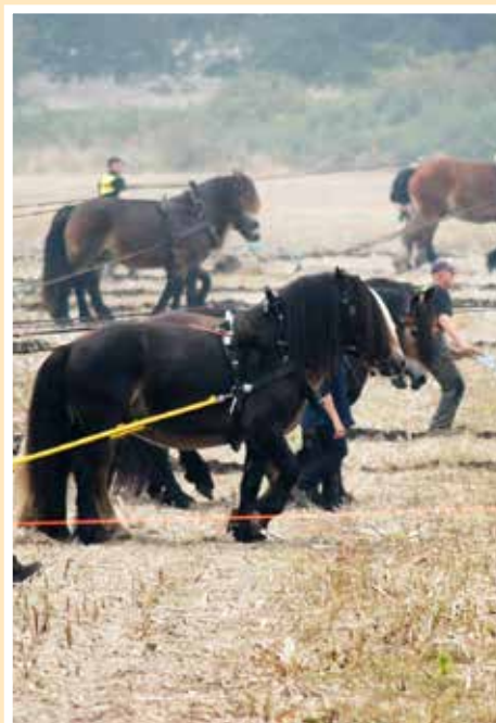
Från DM i plöjning i Skyllberg, hösten 2014.