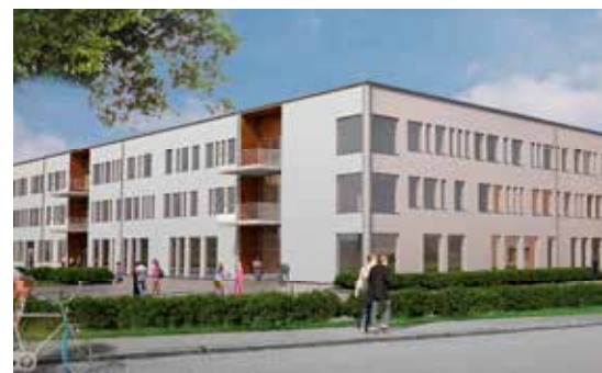
Övre bilden: Huvudentrén med biblioteket centralt placerat. Nedre bilden: Nordvästra fasaden mot den förlängda Sundsbrogatan.

kunskap som kan användas av föreningslivet efter skoltid.