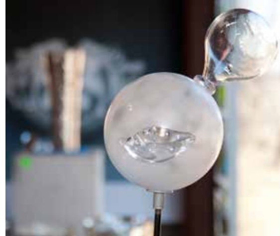
Pratbubbla av Annette Alsiö.