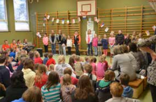
Välkomstceremoni på Rönneshytta skola.