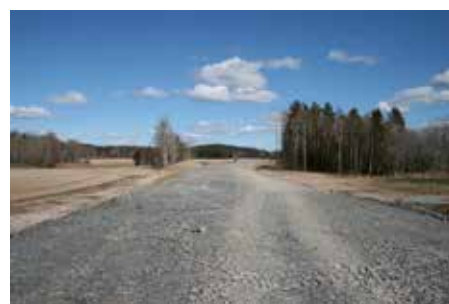
Här växer fram nya sträckningar av riksväg 49.

Av de fem utredningsalternativen passerar tre genom Åsbro samhälle och två mellan Västra Å och Karintorp. De olika alternativen beskrivs i den samrådshandling som Trafikverket har sänt ut under våren för att olika intressenter ska kunna yttra sig om alternativen.