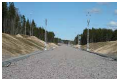
Järnvägsbygge vid Jakobshyttan, strax söder om Mariedamm.

Kommunstyrelsens arbetsutskott vill förorda det västligaste av de alternativ som innebär att järnvägen byggs mellan Västra Å och Karintorp, kallat utredningsalternativ 5 i Trafikverkets handlingar. Slutgiltigt beslut om kommunens remissvar tas när denna tidning gått i tryck. De främsta argumenten för alternativ 5 är miljöaspekter, att relativt få hushåll kommer att beröras av buller och vibrationer samtidigt som det framstår som det gynnsammaste alternativet för järnvägens och logistiknäringens utveckling i Hallsberg. Det slutgiltiga beslutet om järnvägssträckningen fattas av Trafikverket.