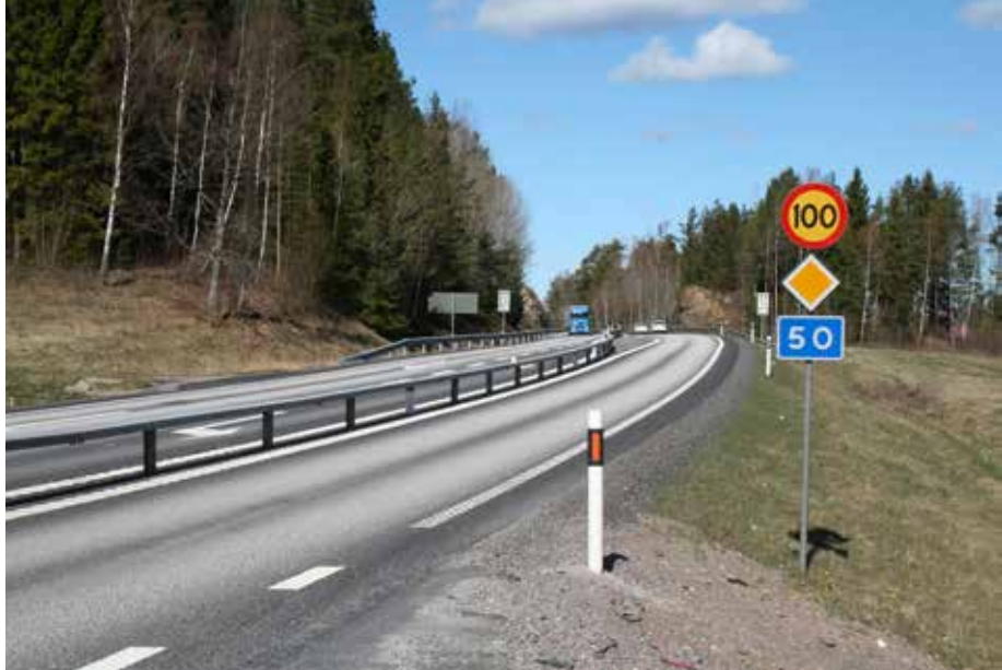
När hela utbyggnaden av riksväg 50 är klar kommer den att vara mötesfri med 100 km/h-standard från E20 vid Brändåsen till E4 vid Mjölby.

Investeringarna i infrastruktur i vår bygd slår alla rekord de närmaste åren. Just nu byggs riksväg 49 och samtidigt planeras det för fortsatt arbete med riksväg 50 och stora investeringar i järnvägen.