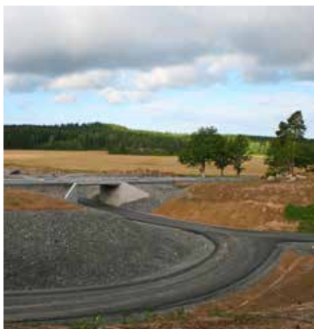
Riksväg 49 och 50 sammanlänkas med en planskild trafikplats vid Stjärnsund, där väg 50 passerar över väg 49.