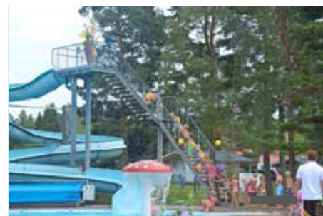
Simskoleavslutning i Hargebaden.