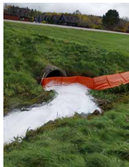
Läns med uppsugande pulver.

vatten från industriområden. En lösning är att samla upp dagvattnet i en våtmark eller damm som kan hindra att föroreningar rinner ut i vattendrag som är mer känsliga.