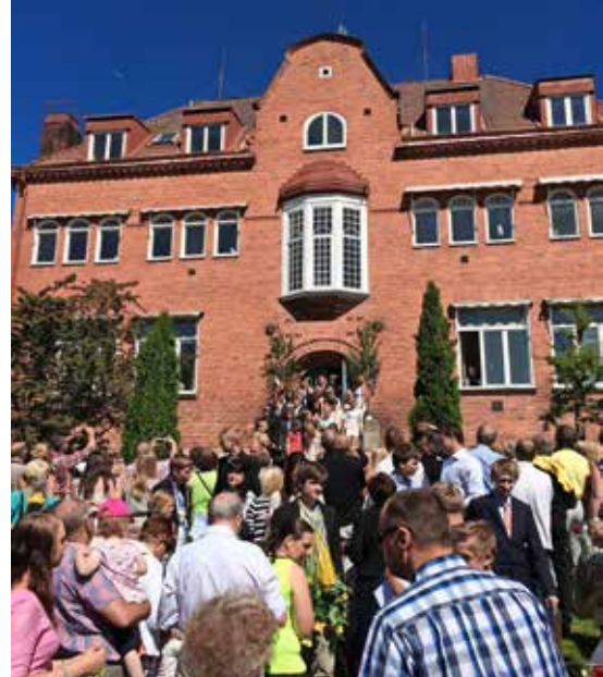
Skolavslutning på Sjöängen 2014. Niorna firas på kanslihusets trappa. För dem som blir kvar på skolan till hösten ska ett stort kvalitetsarbete rulla igång...

Allt hänger ihop när det gäller att skapa en bra skolmiljö. En miljö med klotter, skräp och dåligt inomhusklimat påverkar