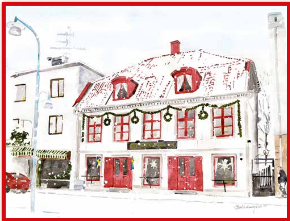
"Tutingen i vinterskrud", en akvarell av Bertil Lundqvist. Finns att köpa som vykort på Bok och Papper samt på Turistbyrån i Askersund.

EN JULHÄLSNING – Ett av många trevliga uppdrag som kommunstyrelsens ordförande är att skriva en julhälsning i vår egen tidning Bo i Askersund. Nu kan vi summera en hel mandatperiod. Väljarna har fått säga sitt och nu ska den "nya" politiken tillträda för att tillsammans förverkliga de idéer och löften som har diskuterats under valrörelsen. Vi som varit med ett tag vet att det inte alltid är så lätt att göra verklighet av alla goda idéer, men jag vågar lova att vi alla gör så mycket vi kan för att skapa en bra och väl utbyggd kommunal service. Detta oavsett om man är oppositionspolitiker eller med i något av de tre styrande partierna. Politik innebär