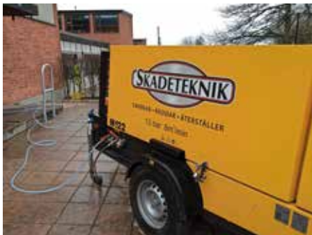
Klottersanering! Skolan ska hålla några år till, och varje dag är ny. Nu utan klotter. Skönt!

skolarbetet. Här har tagits många grepp sedan sommaren. Mätningar görs nu dagligen av inomhusluften och just denna novemberdag klottersaneras hela skolan.