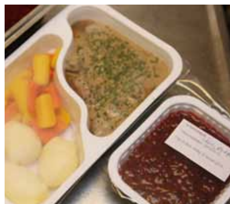
18 januari 2013: Kalops med potatis och morotsklyftor. Till dessert hemlagad hallonkompott. Hemtjänsten hämtar en-portionsmat på Norrbergaköket och kör ut till äldre. Ca 75 portioner/dag.