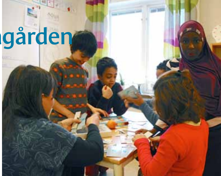
Dags att plocka undan! Sedan är det slutsamling inför helgen.