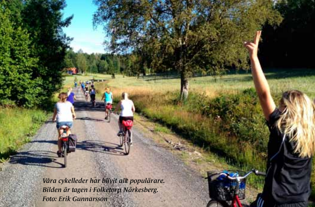
Våra cykelleder har blivit allt populärare. Bilden är tagen i Folketorp, Närkesberg.