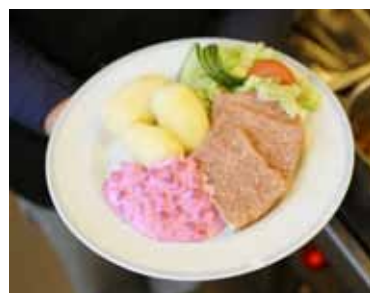
18 januari 2013: Kalvsylta med potatis, rosensallad och råkost. Kvällens middag vid äldreboenden.