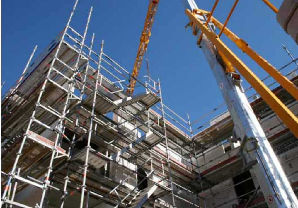
Nybyggnation av Ahnérska huset.