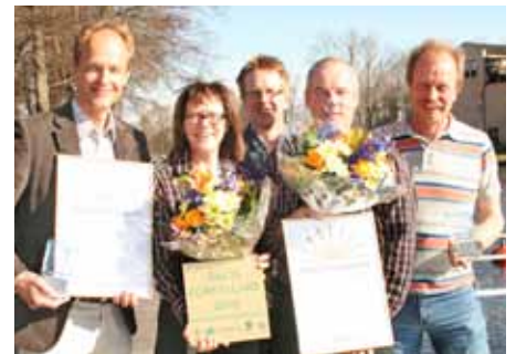
Årets företagare samt utdelare.

Ett helt självpåtaget samhällsansvar som er omgivning här vill lovorda