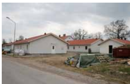
BRA Fastigheter bygger ytterligare parhus i Åsbro.

I Åsbro bygger BRA Fastigheter just nu ytterligare parhus och Åsbroföretaget L3:s Maskintjänst har köpt två tomter för att också bygga parhus på orten. Dessutom kommer ett nytt tomtområde sydost om Åsasjön att börja exploateras.