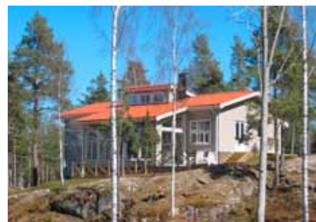
Visningshus på Hammarterrassen.