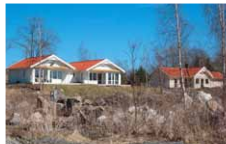
Nybyggda hus vid Bastedalen.