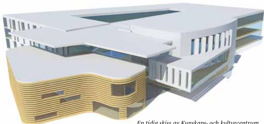
En tidig skiss av Kunskaps- och kulturcentrum. Illustration Norconsult.

Det är brist på bostäder idag. AskersundsBostäder har ett tiotal lediga lägenheter i beståndet på drygt 900 bostäder. I kommunens tomtkö finns 54 intressenter, varav nästan alla har anmält intresse för Edö. 16 är från Askersunds kommun, 30 från övriga länet och 8 från övriga landet. I första etappen på Edö skapas 26 tomter och försäljningen startar i vår via mäklare. I skrivande stund finns 28 villor och radhus (varav två i själva Askersund) och 27 tomter till salu i kommunen på mäklarsidan www.hemnet.se