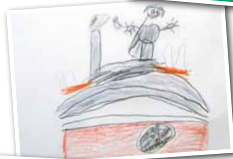
Smeden på Rådhuset.