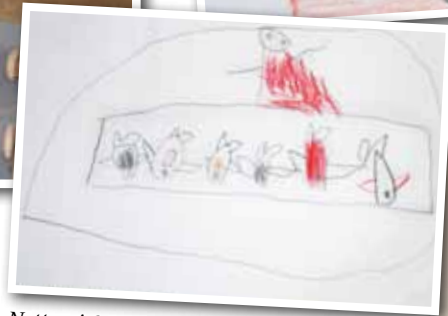
Nettan i fiskdisken.