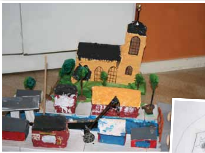
Hamnen – modell gjord av barnen på Björkängens förskola.