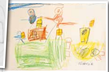
Snäck- och korallbåten.