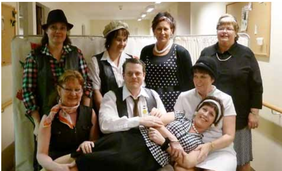
Personalen på Björken har många strängar på sin lyra. Nu driver de folkpark också!

På kvällen bjuder man in till mässbuffé med underhållning till ett pris av 120 kr. Anmälan sker senast 16/3 till hotellet på telefon 0583-120 10. Program och mer information läggs löpande ut på www.askersund.se/levahelalivet