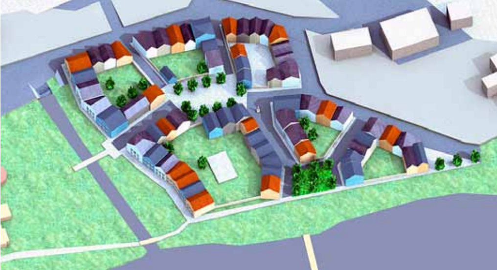
Skissat område vid Haga i Askersund, beläget öster om nuv. reningsverket och med Alsen i förgrunden. Fler skisser och mer om planprogrammet Kulturstaden finns på www.askersund.se/kulturstaden .