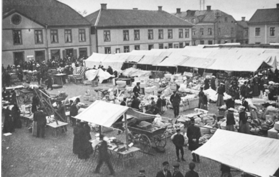
Marknad på torget, sekelskiftet 1800/1900.