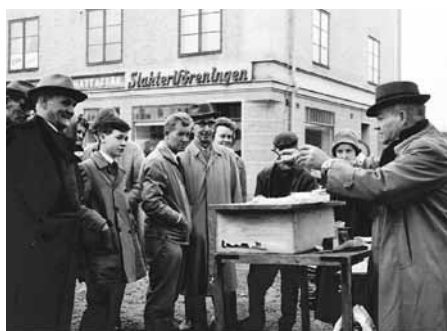
Storgatan/Stöökagatan år 1961.