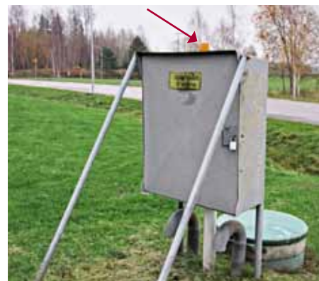
Pumpstation med "saftblandare".

VA-verksamheten i Askersunds kommun är organiserad i en VA-avdelning inom tekniska förvaltningen. VA-avdelningen med 13 medarbetare ansvarar för drift, underhåll och förnyelse av kommunens vattenverk, avloppsreningsverk och tillhörande ledningsnät.