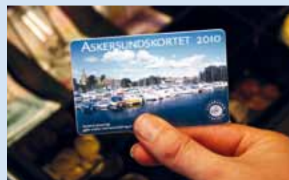
Kortet köps i någon av de anslutna butikerna.

Du köper kortet i de anslutna butikerna och det gäller hela 2010. Kortet är personligt och du har möjlighet att registrera dig för att få erbjudanden från butikerna via e-post.