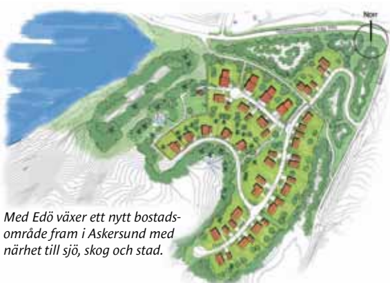
Med Edö växer ett nytt bostadsområde fram i Askersund med närhet till sjö, skog och stad.

Kom och titta på de nya lokalerna, tala med personal och politiker och se hur dagens förskola fungerar!