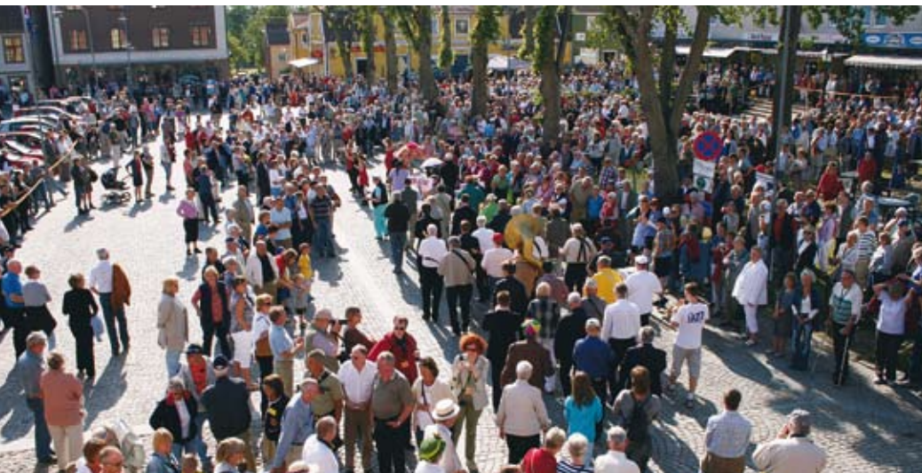
Jazzfestivalen är en trogen publikmagnet! Så här trångt var det på torget vid festivalens invigning 2008.

Det syns inte nu – men det kommer att märkas. Vadå? Jo, att det pågår febril planering inför kommande högsäsong på Askersunds turist- och evenemangsbyrå så här års.