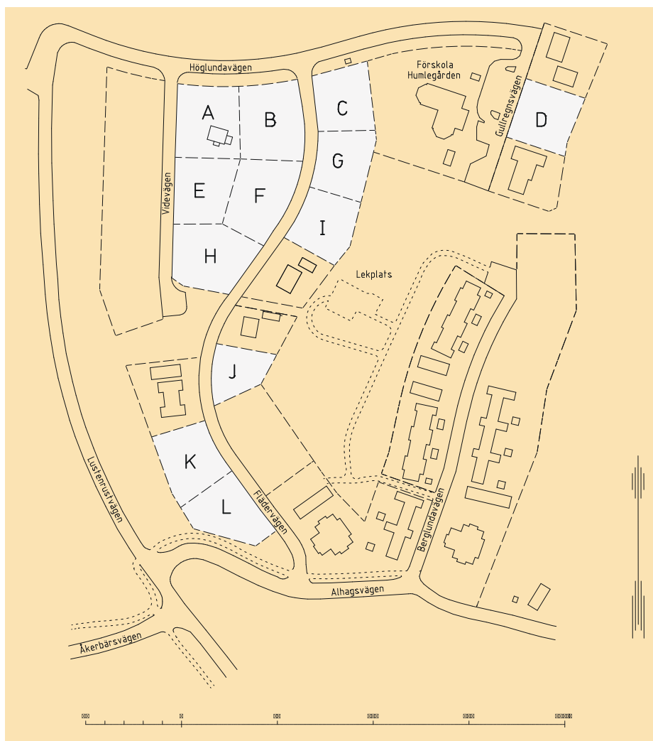
Av skissen framgår vilka tomter som är lediga i Gustavslund, Askersund.