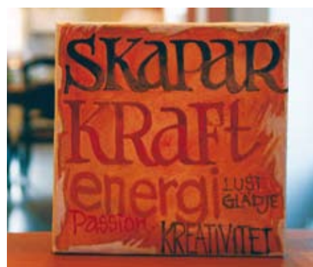
Allt från butikens försäljningsdisk och trapp-räcke till dekorativa tavlor är till salu i paret Vissbergers inredningsföretag.

”Vi har visioner och ser möjligheter, överallt. Inte bara när det gäller inredning och vårt företag.”