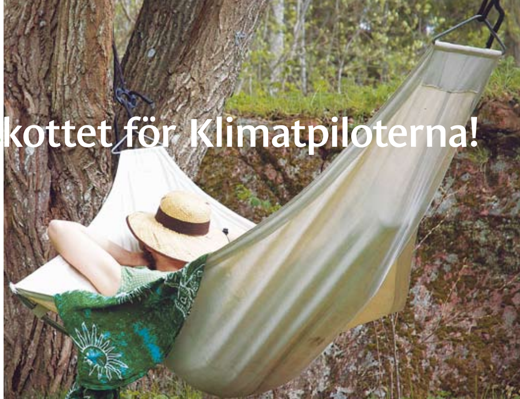
Snart avslöjas vilka som är Klimatpiloter och kan ligga kvar i hängmattan.

De tio pilothushållen kommer under ett års tid få kunskap och coachning i att minska sina utsläpp av växthusgaser. Hushållen kommer att ställas inför en utmaning i månaden inom områden som konsumtion, hus & hem, mat, korta &