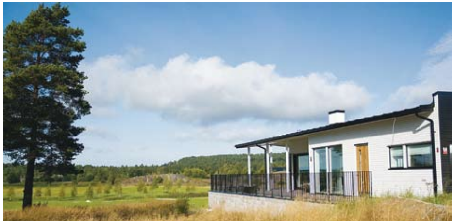
Med vy ut över golfbanan i Åmmeberg bygger Dormy Fastigheter AB bostadsrätter för semesterboende. 24 av de 26 bostadsrätterna är redan sålda, och de första familjerna är i färd med att inreda och flytta in. De flesta kommer från Örebroregionen.

Under många år var Åmmeberg en bruksort, där det mesta kretsade kring gruvbolaget Vieille Montagne (idag Zinkgruvan Mining AB). Initiativet låg på bolagets bord, och skulle det hända något, så var bolaget oftast finansiär och motor. Att det blev lite tyst i samhället när företaget koncentrerade verksamheten till Zinkgru-