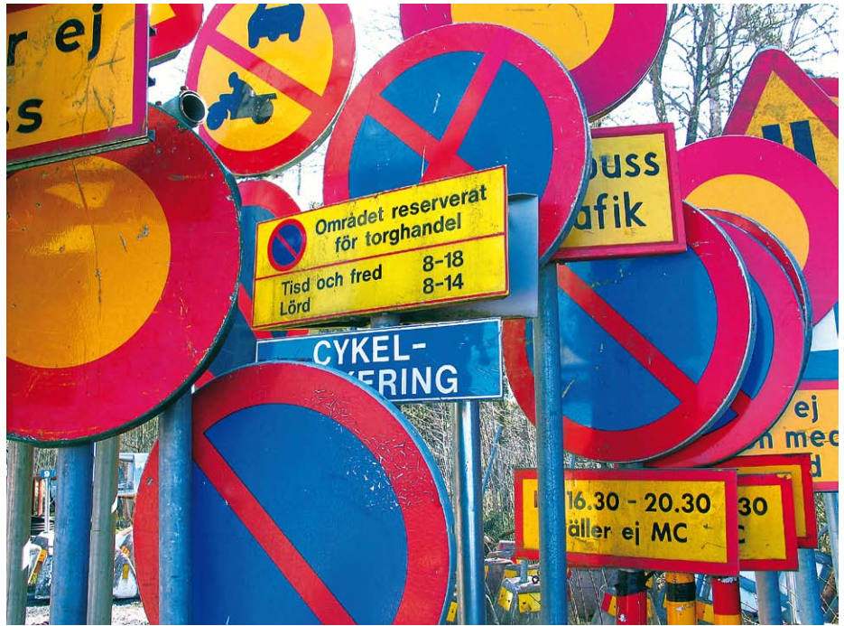
En inventering av trafikskyltningen i kommunen väntar.

– Till att börja med ska vi få utbildning i systemets användning. Därefter är det många uppgifter som ska föras in, som idag finns i pärmar. I ett längre perspektiv är det nya systemet ett viktigt verktyg för att kunna ta tillvara all den