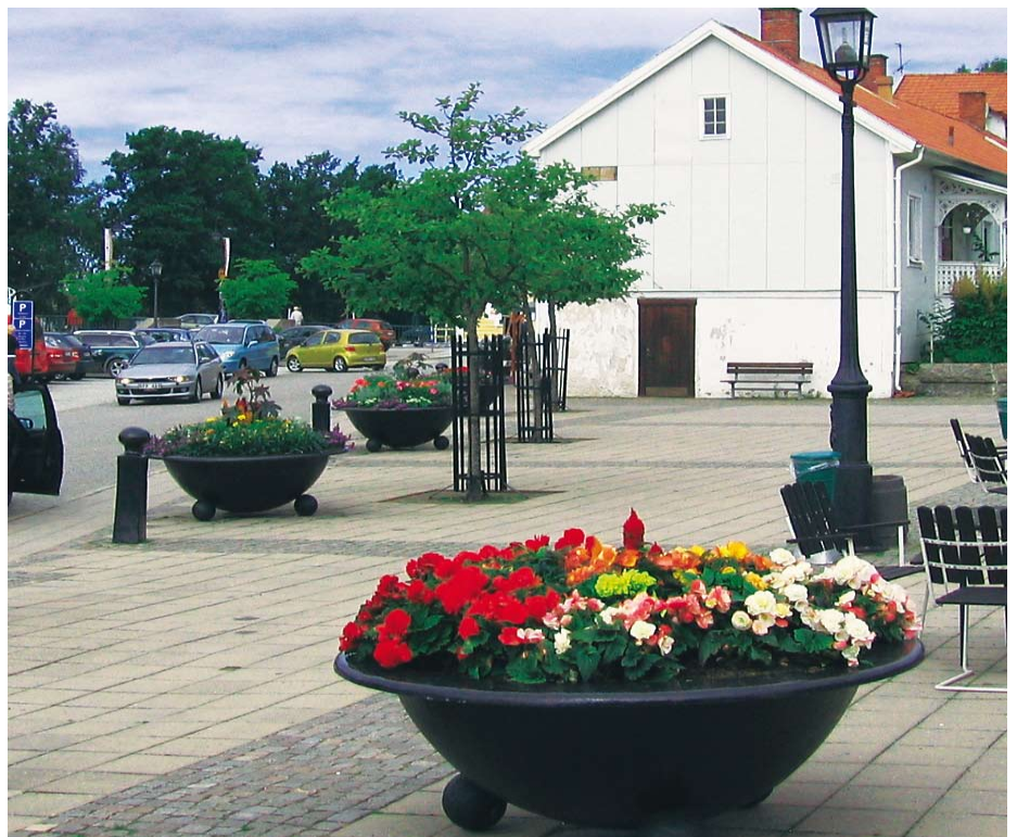
Blommorna börjar planteras ut i slutet av maj. Urnorna är på plats efter skolavslutningen.

Olshammars centrum – Området rustades förra året och i sommar ska centrum prydas av två blomsterurnor.