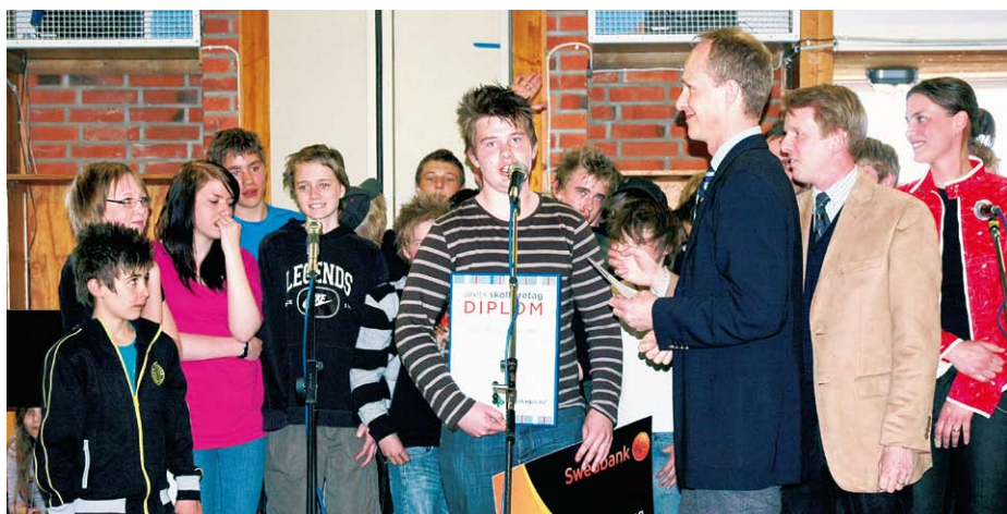
Glada pristagare fick ta emot en check på 10 000 kronor.

Medarrangörer/sponsorer är Företagarna, Utvecklingscentrum, Askersund i centrum, LRF, Swedbank AB, Skyllbergs Bruks AB och Bild & Kultur AB.