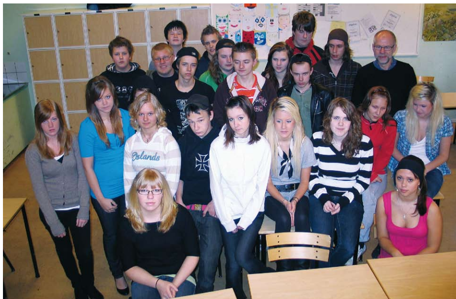
Klass 9 F har jobbat ihop i tre år i sina klassföretag och fått ihop omkring 70 000 kronor.

Sitt eget stora engagemang för klassen förklarar han med att han inte kan låta bli.