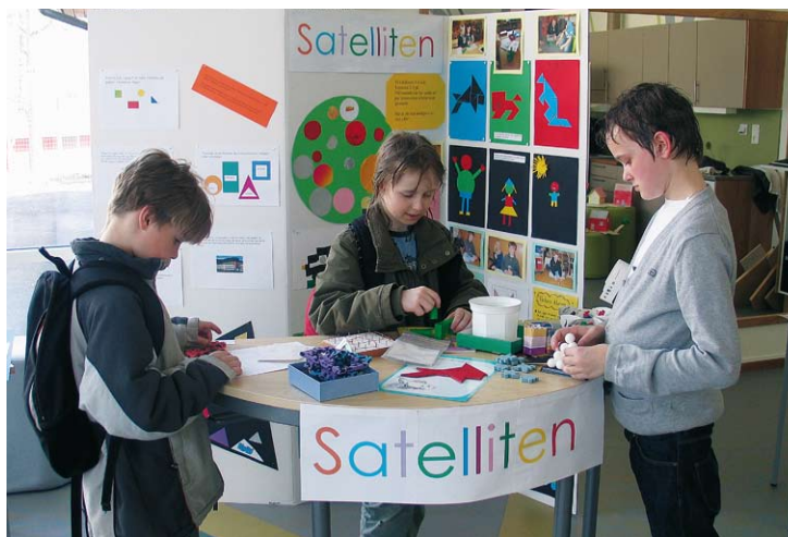
Geometri kan vara spännande och kul.

Bo i Askersund är en informationstidning för alla som bor i Askersunds kommun. Tidningen kommer ut fyra gånger per år och distribueras till hushåll och företag.