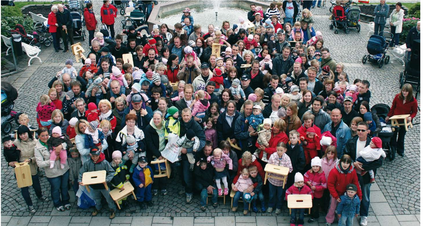
Den 17 maj delade Askersunds kommun ut en pall till barn födda 2007. Efter utdelningen blev det uppställning för den traditionella grupp bilden.