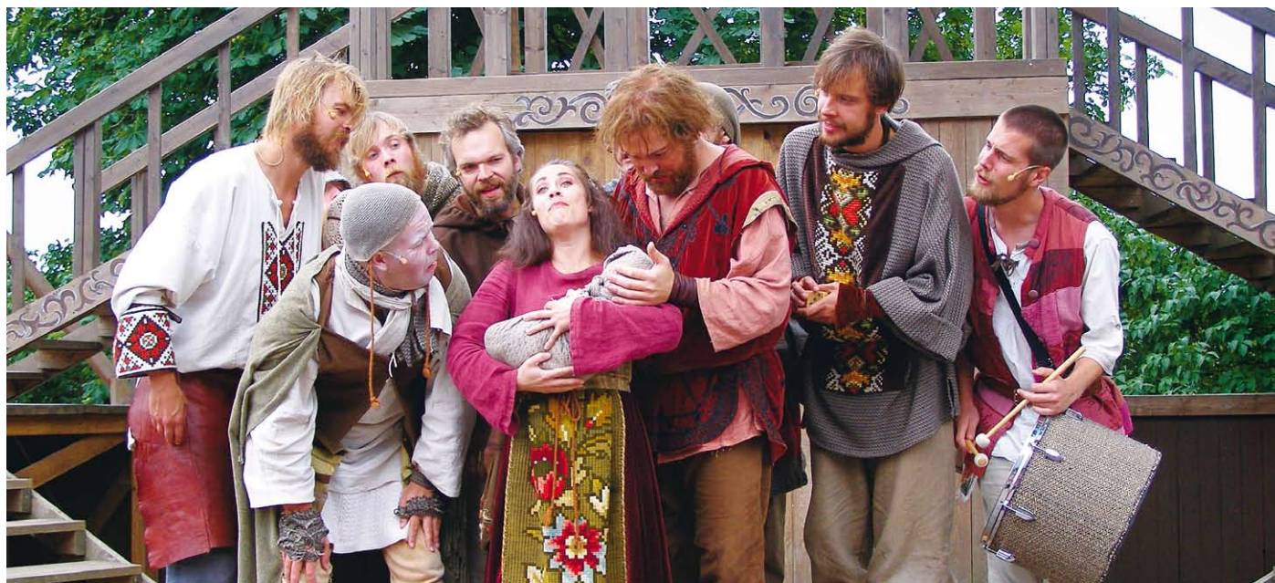
Ronja Rövardotter sommaren 2007.