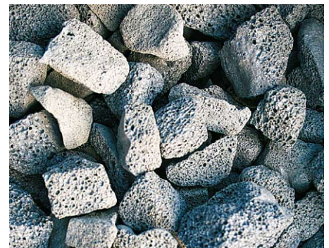
Försäljningen av Hasopor har redan överträffat planeringen och materialet lovordas för sina fina egenskaper.

– Ett av våra första byggprojekt där vi fått förtroendet att leverera skumglas