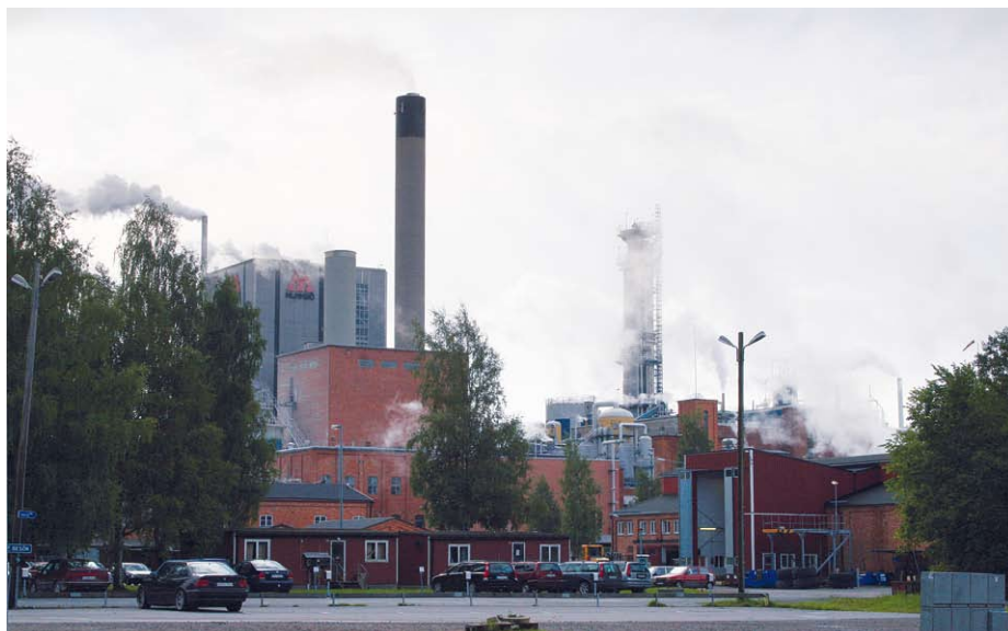
Munksjö Aspa Bruk har varit i drift i 80 år och är idag en av världens effektivaste massafabriker.

Dessutom satsar man tillsammans med E.On Vind på en vindkraftpark inom industriområdet, som kommer att ge cirka 35 000 MWh. Totalt kommer man alltså att producera ca 140 000 MWh elenergi per år, vilket ju överstiger industrins eget behov. Framtidens elbehov för Aspa Bruk är ca 125 000 MWh/år. Industrier som är nettoproducenter av el hör minnsann inte till vanligheterna!