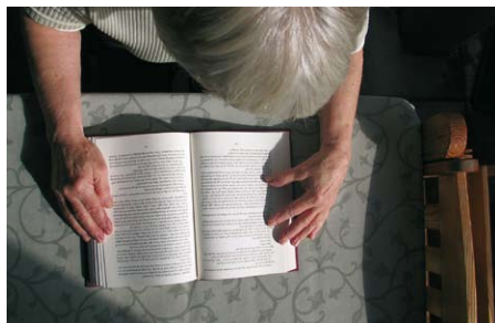
I Måttligans rapport jämförs särskilda boenden i fem kommuner.

För att få en bild av skillnaderna i kvaliteten har kommunerna fått svara på ett antal frågor, detta benämns som