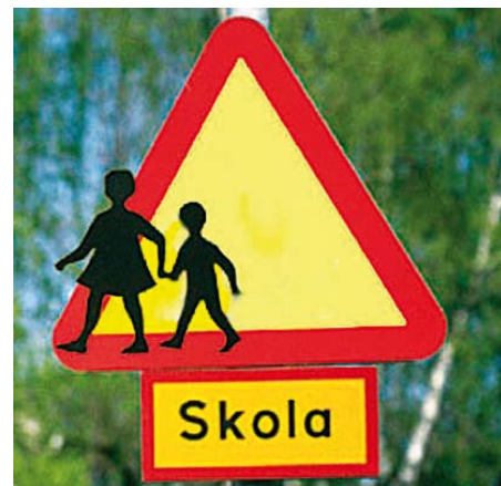
Till skolk räknas bland annat sen ankomst till lektionen.