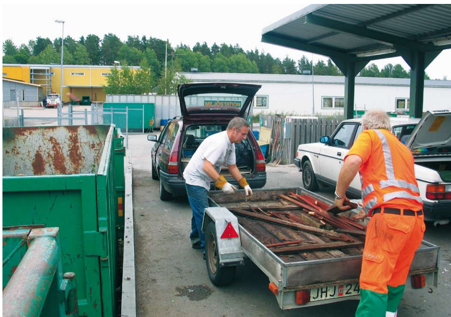
Metallföremål som till exempel förbrukade cyklar, metallhinkar, stuprännor och annat avfall som innehåller stora mängder metall lämnas på kommunens kretsloppsstation.

Askersunds kommun har antagit en ny avfallsplan. Den visar bland annat hur kommunen ska minska avfallets mängd och farlighet.