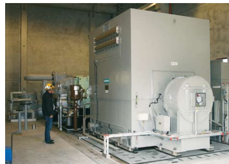
Den nya turbinen kan nästan försörja hela fabriken med egenproducerad el.

– Vi har idag världens lägsta elenergiförbrukning per ton blekt barrmassa. Detta är en följd av att vi har investerat cirka 1 miljard kronor i fabriken de senaste tio åren. Klimatfrågor ligger verk-