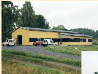
AD-Trycks nya tryckeri på Närlunda industriområde.

Byggplats för Hammar VVS-tekniks nya lokaler.