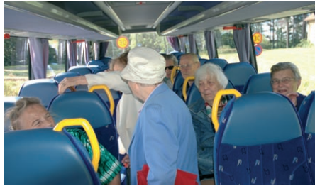
Damerna sitter gärna långt fram i bussen medan herrarna tydligen föredrar att sitta längre bak.