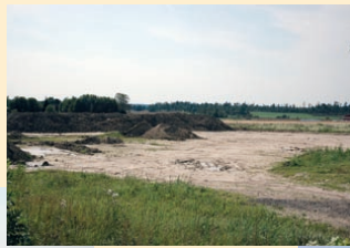
Ullavi industriområde byggs ut.

Byggplats för Hammar VVS-tekniks nya lokaler.