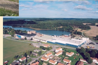
Norska Hasopor etablerar sig i Hammar.