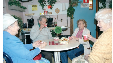
En kopp kaffe hinner vi allt med innan det bär hemåt igen.