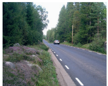
Det sommarfagra Tiveden har fått en nyasfalterad väg.