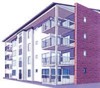
Illustration: AskersundsBostäder AB

– Antalet elever på Sjöängsskolan är numera betydligt lägre än tidigare. Sjöängsskolan ska genomgå en omfattande renovering och förändring och de markytor och utrymmen vi har inom den huvudsakliga, befintliga tomten räcker bra för framtida behov. Den södra delen ska därmed kunna