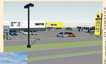
Illustration: GL CONSULT