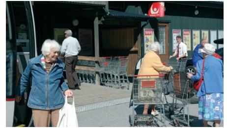
Nu ska här handlas!

Varuförsörjning på landsbygden är ända sedan 1970-talet ett samarbete