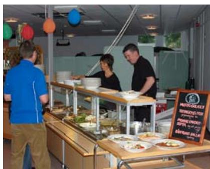
Café Tutingen förgyllde mässan med god mat och dryck.