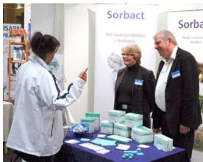
Abigo visar sina sårläkande produkter.