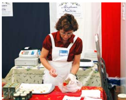
Madame Nature bjuder på franska delikatesser.