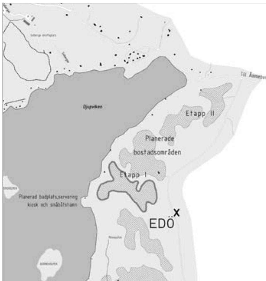
Illustration: mätningssingenjör Tomas Wall