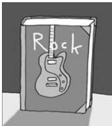
Illustration: Bo Rosander

Askersunds kommun har i sitt strategiska program inskrivet att kommunen vill "etablera lokala gymnasieutbildningar inom bland annat turism- och besöksnäring samt jazz- och rockmusik".