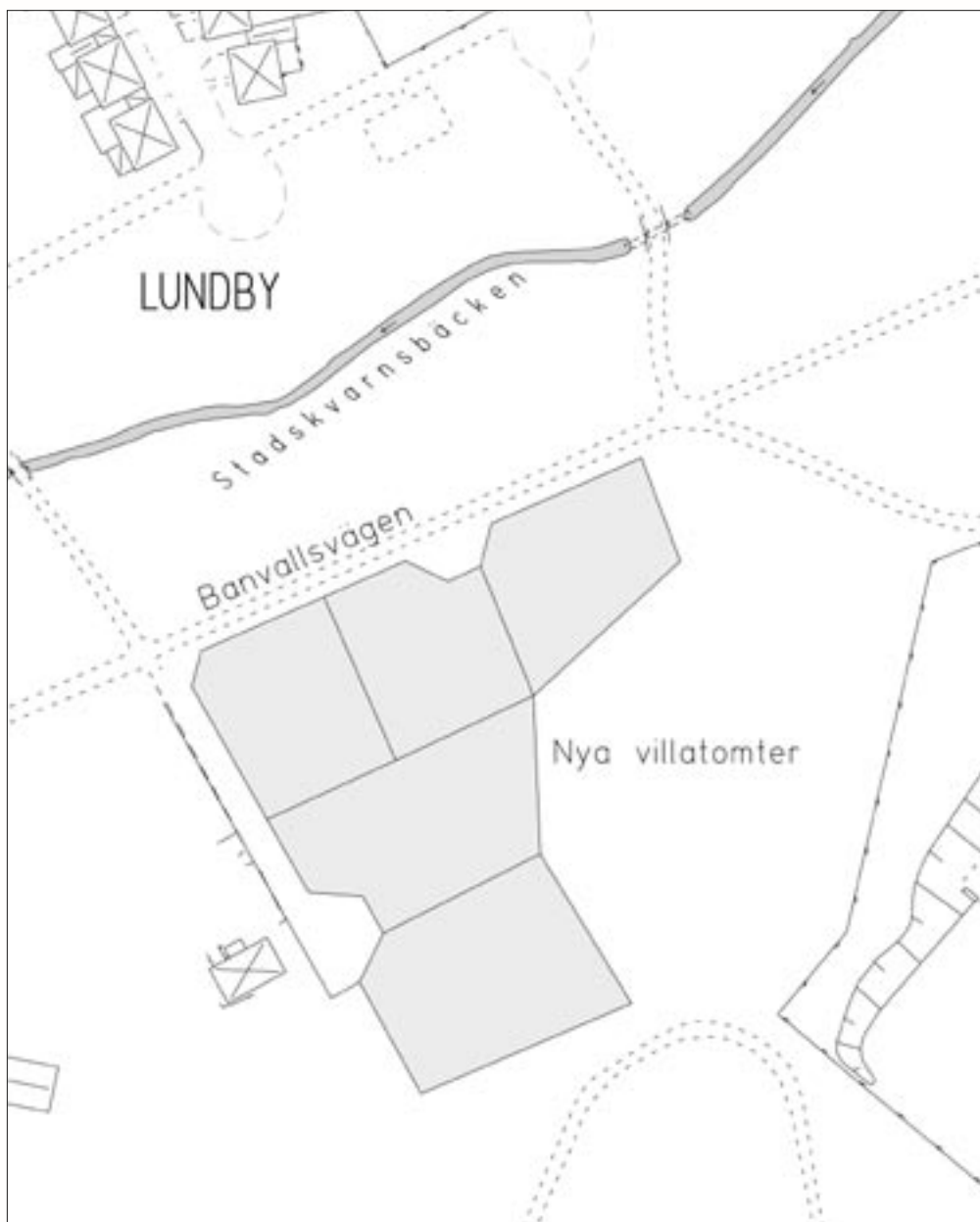
Illustration: mätningingenjör Tomas Wall