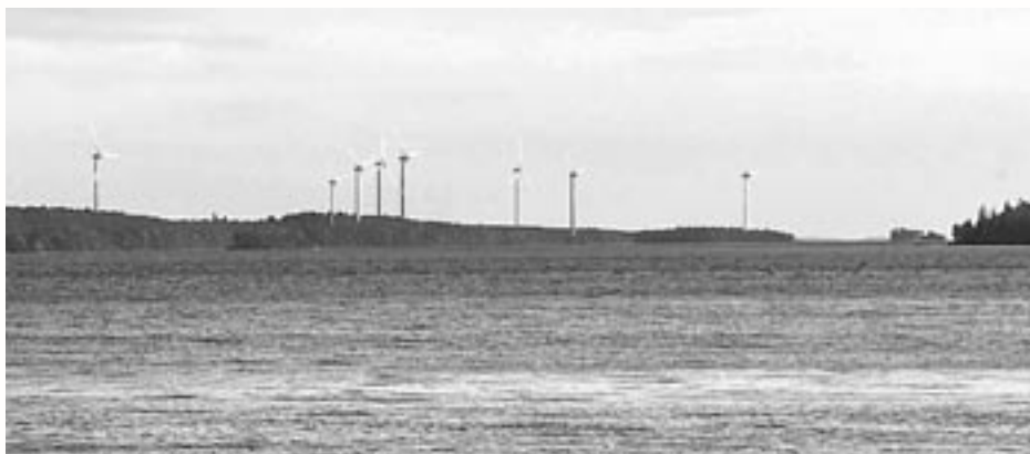
Bilden är ett montage.