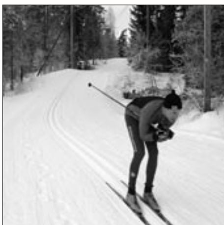
Full fart i vasaloppsträningen.

Den senaste investeringen uppgår till 600 000 kronor och den årliga driften, inte minst i framställningen av konstsnö, kostar mycket.