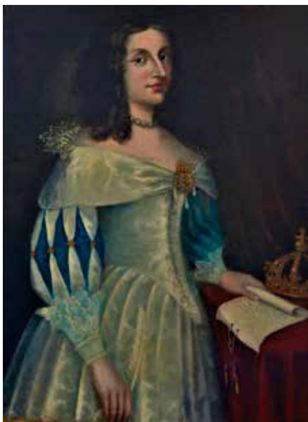
Tavla i Rådsalen i Askersund.