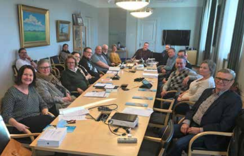
Kultur- och tekniknämndens ledamöter på sitt första sammanträde för den nya mandatperioden.