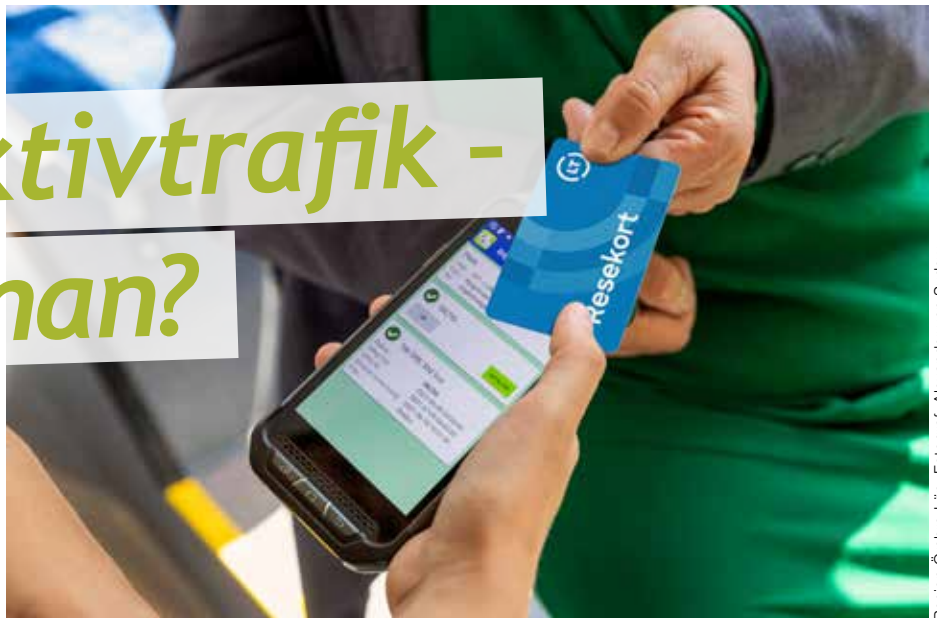
Region Örebro Län, Fotograf: Alexander von Sydow

Om du vill åka en längre sträcka är Samtrafikens hemsida resrobot.se en bra tjänst. Den kombinerar landets tåg, bussar, tunnelbanor, flyg och spårvagnar.