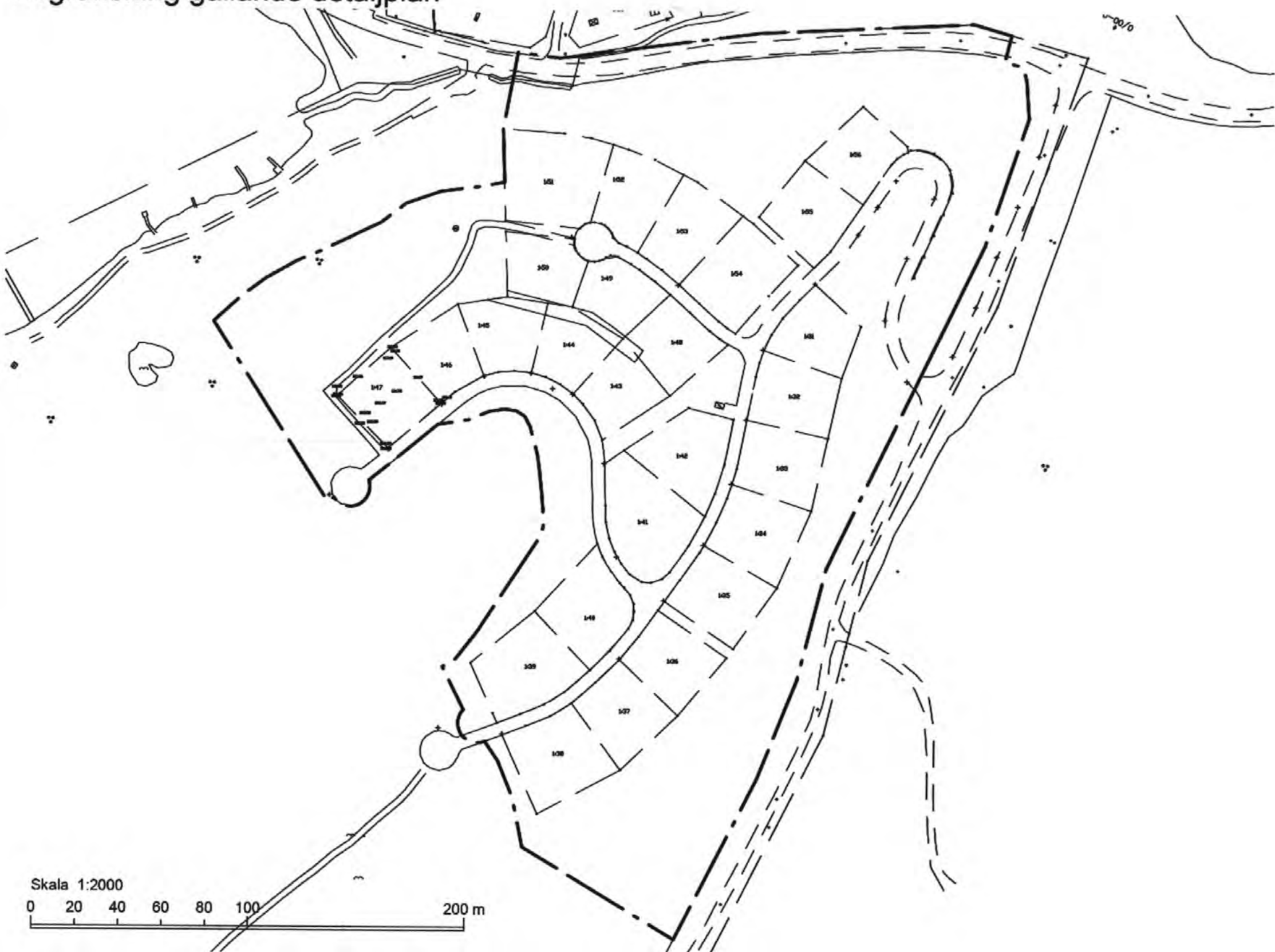
Avgränsning gällande detaljplan